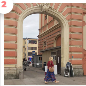
Вход в арку, не доходя до «Глобус Гурме»