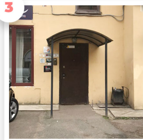
Нужный вход в здание, код домофона 44